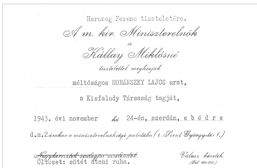
A m. kir. miniszterelnök meghívója Herczeg Ferenc 80. születésnapjára (Horánszky Nándor tulajdona)

Bizonyára eljön a kor, amikor Herczeg megítélésében nemcsak politikai magatartása és sokaktól nehezményezett „sváb” mivolta adja meg a fő hangot. Számomra a vele való kapcsolat életemnek egyik kedves epizódja marad.