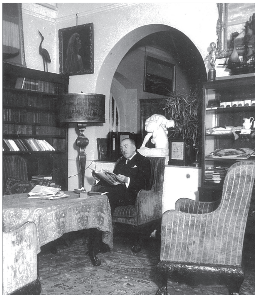
Herczeg Ferenc a villájában (Vadas Ernő felvétele, 1936)

Herczeg számos megemlékezése közül hármat említünk meg, melyeket a Tisza Emlékbizottság összejövetelein mondott el. Az első 1921. február 24-én hangzott el a Tisza Emlékbizottság előadásán a Gellért Szállóban. 7 Itt