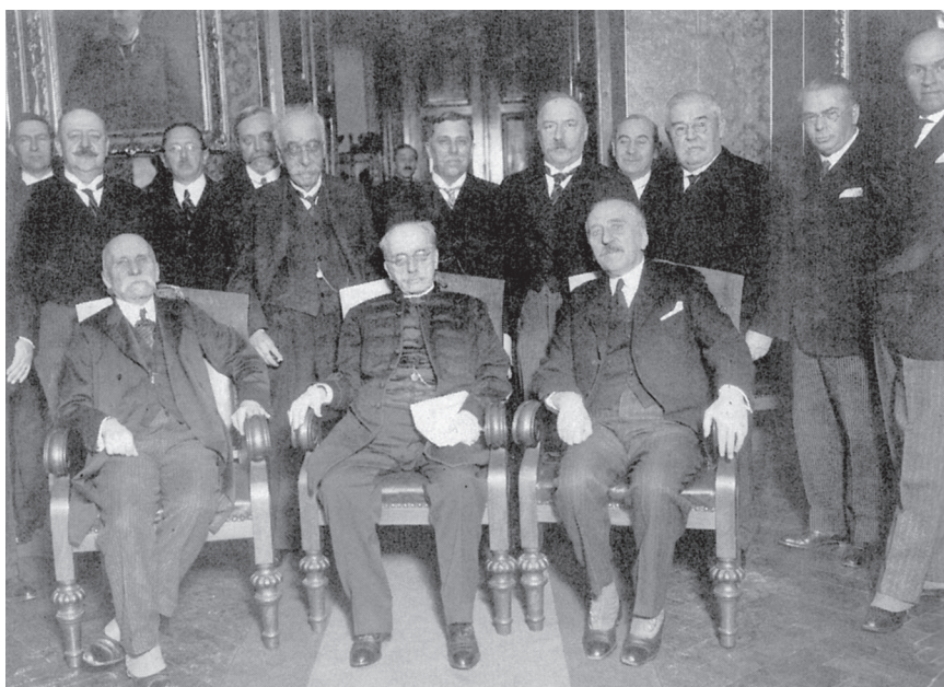
Kenedy Géza, Berzeviczy Albert, Herczeg Ferenc a Kisfaludy Társaság ülésén