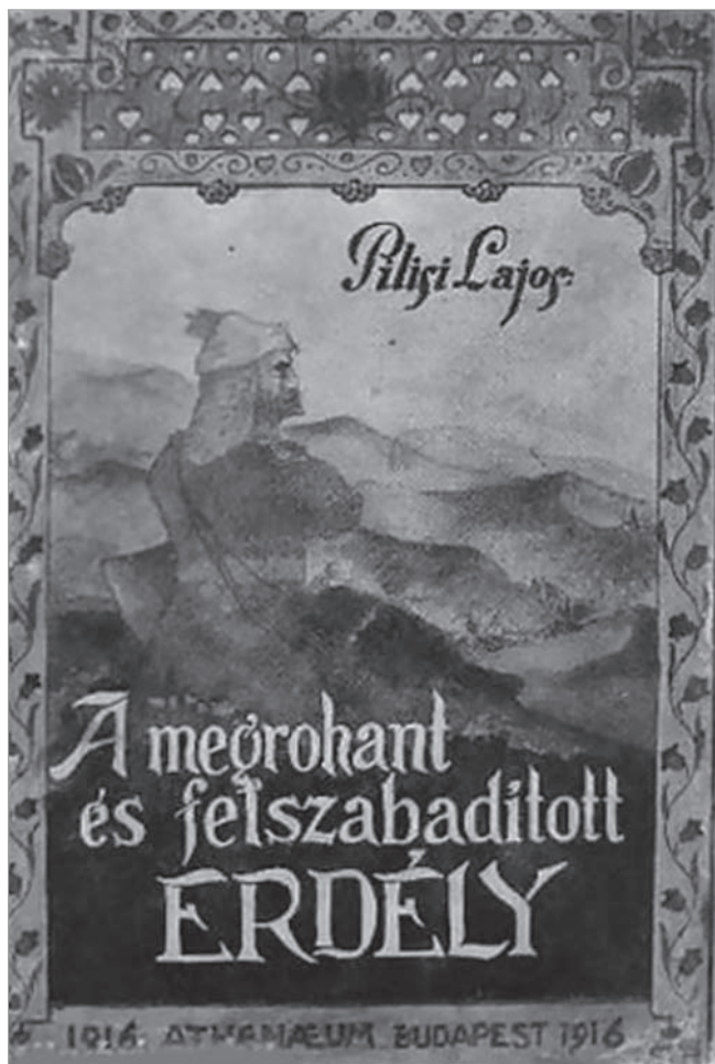
Pilisi könyvének borítója

ságteljes önbizalom és a határozott cselekvőképesség start-köveinél. A nemzeti szellem és a nemzeti akarat megnyilvánulásainál, amely Maderspach Viktoréknak elszántságot adott, hogy szabadcsapatokkal küzdjenek a betolakodók ellen – és amely a Pilisi Lajos nevű nagyszerű krónikással leírta az alábbi sorokat: „Erdély ott kezdődik, ahol a honfoglalás”. Ahol a magyarság, tehetjük hozzá.