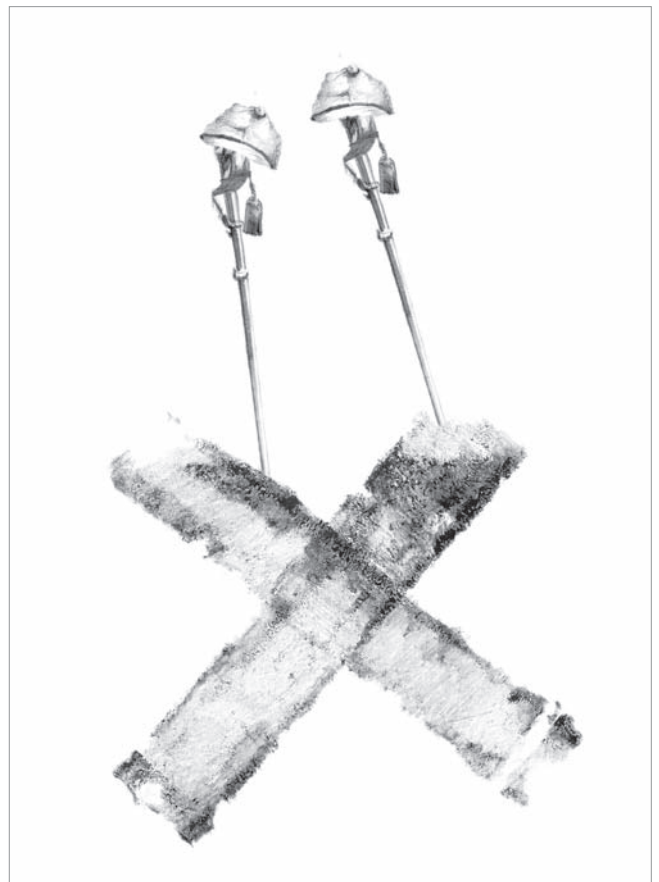
Veszeli Lajos könyvillusztrációja

A kor magyar diplomáciai lépéseit az óvatosság jellemezte, és a sok belülről és kívülről jövő figyelmeztetés, a számtalan veszély-jelzés sem készítette arra az ország politikai vezetőit, hogy megfelelő lépéseket tegyenek azok elhárítására, enyhítésére. Ebben jelentős szerepet játszott két ideológiai tényező: az egyik Magyarország védőbástya -szerepe (nevezhetjük védőbástya-metaforának is). Ebből hiányzott az európaiak háláérzete, mint kompenzációs attitűd. Vagyis Magyarország mindenkori politikai vezetői