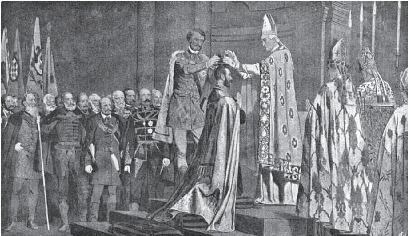
A király koronázása (Vasárnapi Ujság, 1898. január 2.)

Az 1848–49-es forradalom és szabadságharc hatását végigkísérhetjük az egész 19. és 20. századon, és ma is muníciót nyújt a magyar léleknek. A cári hadsereg hatalmas haderejének segítségével a Habsburgok leverték a szabadságharcot, a kiegyezést azonban nem „úszhatták” meg.