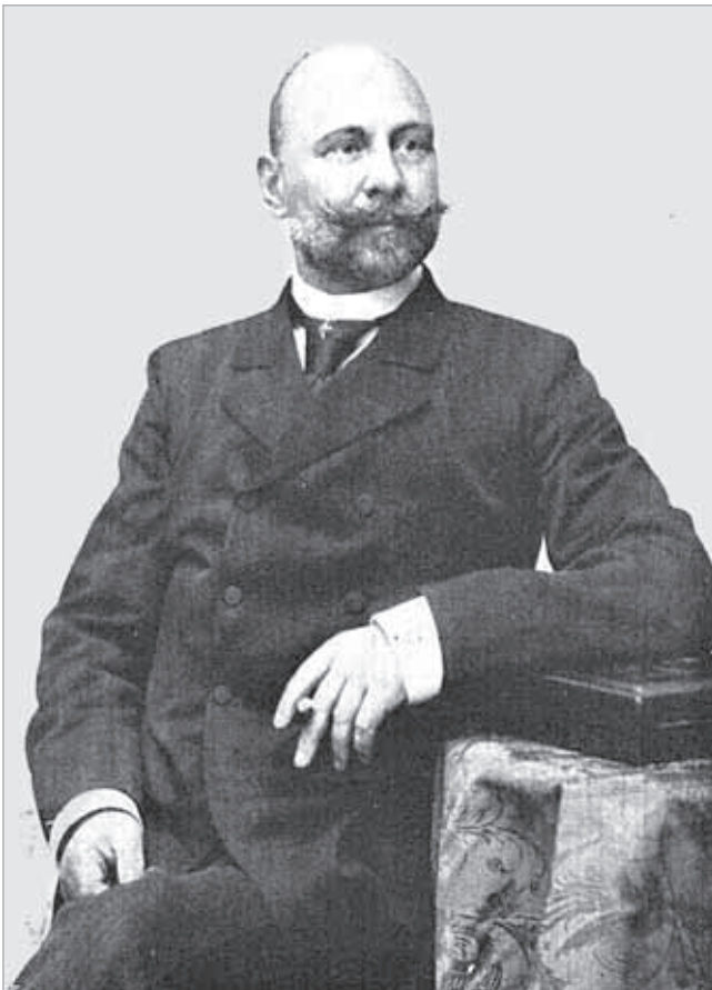
Bárány Dezső, miniszterelnök

Mocsáry Lajos volt az egyetlen képviselő, aki a nemzeti kérdés radikális megoldását követelte, és aki ezért a saját pártjával, a Függetlenségi Párttal is konfliktusba került (párttársai akadékoskodónak tekintették). Mocsáry a konfliktus elmérgesedését jelezte előre, amennyiben a magyar politika továbbra is szembemegy a nemzetiségekkel. Félelmei később beigazolódtak. Pedig ő csupán az 1868. évi nemzetiségi törvény végrehajtását és betartását követelte. A nemzetiségi törvény alvó állapotban tartása 12 azonban a képviselőházban és általában a társadalomban