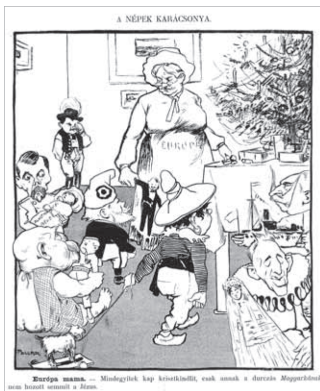
Európa mama. – Mindegyitek kap krisztkindlit, csak annak a durczás Magyarának nem hozott semmit a Jézus. (A népek karácsonya, Borsszem Jankó, 1910. december 24.)

dásokat fogadja el. Aki a keresztény nemzeti vonalat követi, azt félreállítják, a kulturált európai nemzetek sorából kiiktatják. Eszközük: a nacionalizmus, a fasizmus, a rasszizmus és az antiszemitizmus vádja. Miként a Trianon előtti évtizedekben, a globális háttérhatalmak ma is ezekkel a módszerekkel próbálják többek közt belekényszeríteni saját érdekrendszerükbe a „renitens” országokat és politikusokat.