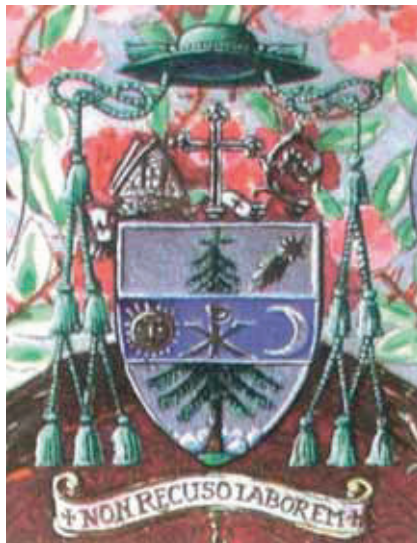
Márton Áron gyulafehérvári püspök címere

Ebben az időszakban készült csodálatosan precíz vízfestése IV. Béla király 1240-ben kiadott kettős pecsétjének elő és hátoldaláról. Utóbbin látható az Árpád-házi királyok hatalmi jelképe, az apostoli kettős kereszt, amelyet az önállóvá vált Szlovákia eltulajdonított megújított állami címerébe.