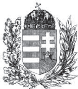
A Magyar Királyság középcímere és kiscímere tölgy- és olajággal övezve

a beékelésben a Fekete-tenger partvidéke, vagyis Dobrudzsa címerképei láthatók.