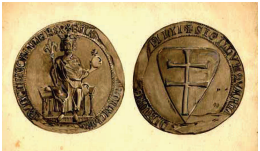
IV. Béla kettős pecsétje

A román hatalomátvétel után bizonytalanra vált a sorsa. 1945-ben a meg-