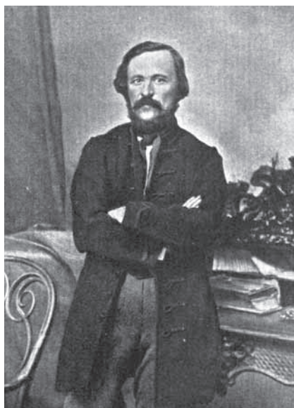
Báró Eötvös József

Ha meg akarjuk ismerni az elmúlt kétszáz év történelmét, meg az elkövetkező (nem tudjuk, hány év) időszak történelmét, akkor az áruk útját kell követnünk. Például a fegyvergyártás, a fegyverkereskedelem s a fegyverek felhasználásának útját s módját, no meg az extraprofit útját, ami legin-