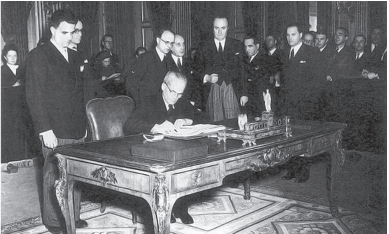
1947. február 10-én Gyöngyösi János külügyminiszter Párizsban aláírja a békeszerződést

nösként megbélyegzett magyarság jelentős részének – mintegy kétszázezer főnek – a kitelepítése (amit Sztálin „jó dolognak” tartott, de a nyugati szövetségesek elutasították), míg másik igénye a pozsonyi hídfő öt magyarországi településének (Oroszvár, Horvátjárfalu, Dunacsún, Rajka, Bezenye) megszerzése volt. 10