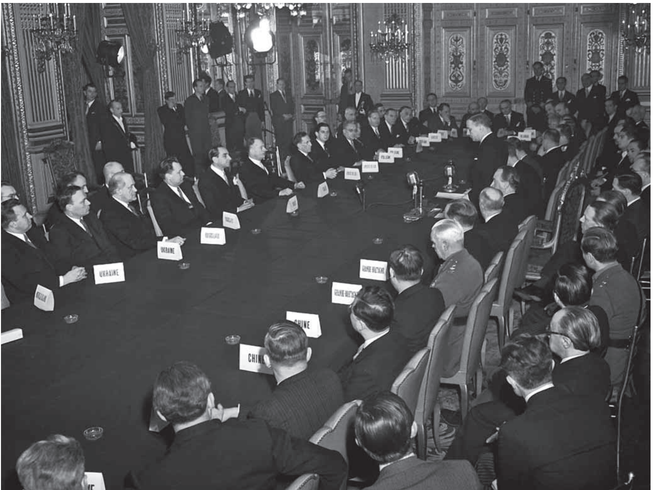
A párizsi békeszerződés kihirdetése

A világháború győztesei – a Szovjetunió, valamint Nagy-Britannia és az Amerikai Egyesült Államok – egyetértettek abban, hogy a magyar békekötés kapcsán a hazánkkal szomszédos államok közül a velük szövetségesek (Csehszlovákia és Jugoszlávia) és az ellenségesek (Románia és Ausztria) más-más elbírálás alá essenek. Ennek szellemében a magyar államhatár megállapítása során föl sem merült, hogy Jugoszlávia, illetve Csehszlovákia kárára Magyarország gyarapodjon. Egyedül a romániai, Trianon előtt a történelmi Magyarországhoz tartozó területek (egy ré-