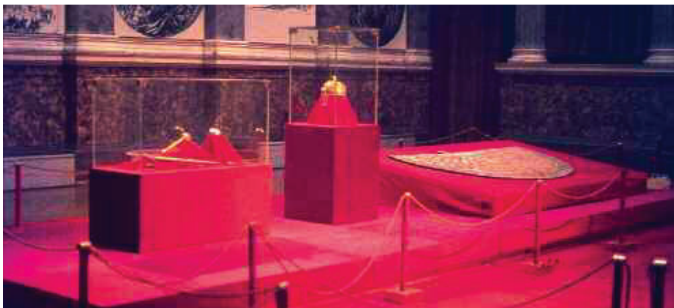
Koronakiállítás 1978–1997. Szent Korona, koronázási jelvények, palást tárlói

1953. március 23-án a Szent Korona, az Országalma, a Jogar, a Koronázási Kard és a Koronázási Palást az amerikai Fort Knox katonai erőd 31. számú kamrájában a legnagyobb védettség mellett rejtették el. A kamra lelakatolt és lepecsételt ajtajáról a lakatot és a pecsétet csak 1977. decem-