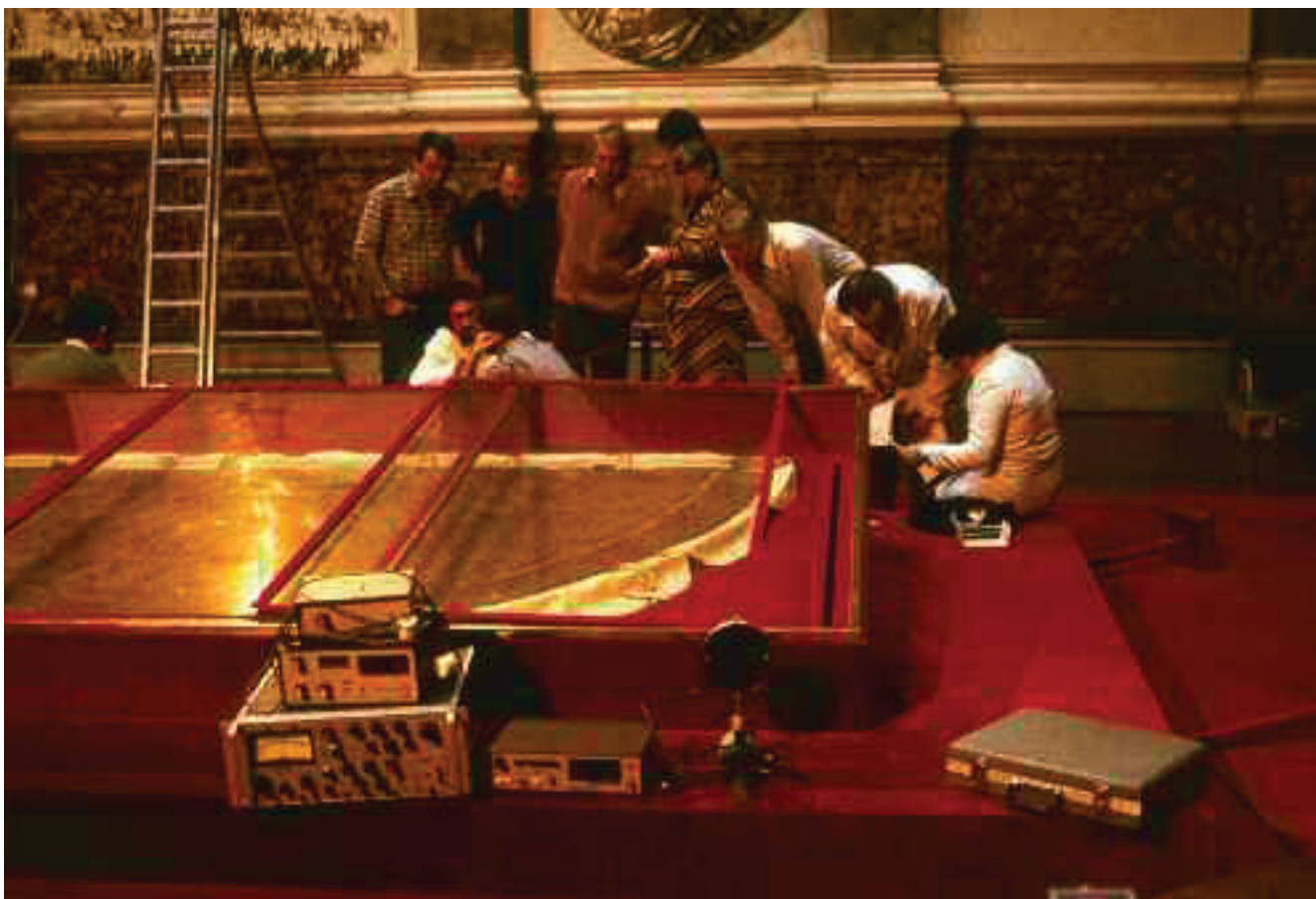
Konzultáció és mérések a tárlónál