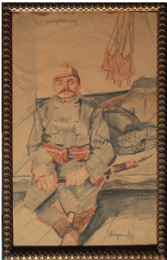
Mednyánszky László: Őrszolgálatosok

A kiállításon szereplő három rajzon az előkészítő fázi-