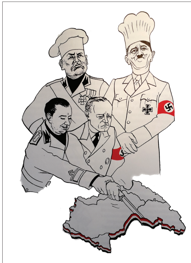
Az Axis „Európa-tortájának” bécsiszetelei

Jó lapozni, olvasni ezt a könyvet. Sok alapvető információt megismerhetünk, és összeállhat a kép, amelyből a különböző