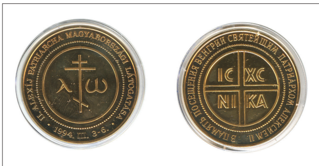
II. Alexij patriarcha látogatását megörökítő emlékérmé

Egyházi tanulmányait 1947–1949 között a leningrádi Teológiai Szemináriumban végezte. Grigorij leningrádi metropolita 1950. április 15-én diakónussá, majd április 17-én pappá szentelte. Felsőfokú tanulmányait 1953-ban a leningrádi Teológiai Akadémián fejezte be. 1957. július 15-én kinevezték a tartui kerület esperesévé, 1958. augusztus 17-én pedig püspökké.