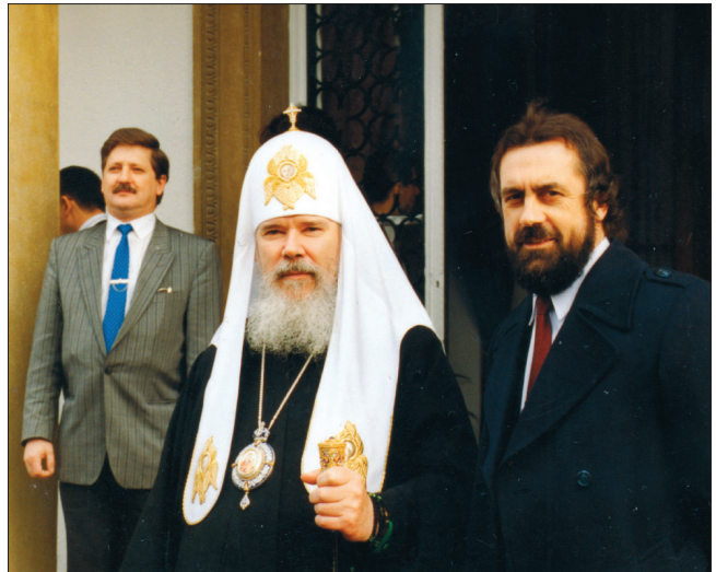
Indulás előtt a Vendégház bejáratánál

Az ünnepi liturgiát követően a küldöttség és a meghívott vendégek átmentek a Duna-palotába. Elsőként a négynapos történelmi látogatást kiértékelő sajtótájékoztatóra került sor, ahol nagy érdeklődés mellett a hazai és külföldi újságírókat tájékoztattuk a lezajlott eseményekről. Ennek végén II. Alexij bejelentette, hogy 1996-ban remélhetőleg sor kerül Pannonhalmán a Bencés Főapátságban a II. János Pál pápa-