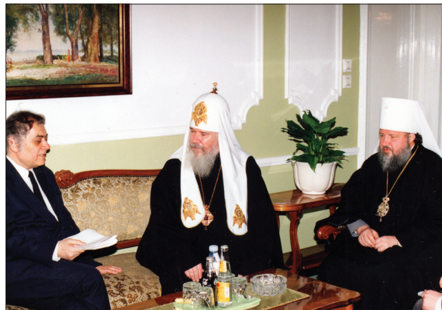
Csoóri Sándor dolgozószobájában tárgyal II. Alexij patriarchával és Kirill metropolitával

II. Alexij patriarcha és küldöttsége a fogadóbizottsággal együtt, ezt követően a jelenlegi Duna-palotába hajtott, ahol Göncz Árpád köztársasági elnök díszbédet adott a vendégeknek és a négy nap vendéglátóinak. A díszbéd után II. Alexij patriarchát és Kirill metropolitát a Magyarok Világszövetsége Benczúr és Bajza utca sarkán lévő akkori székhá-