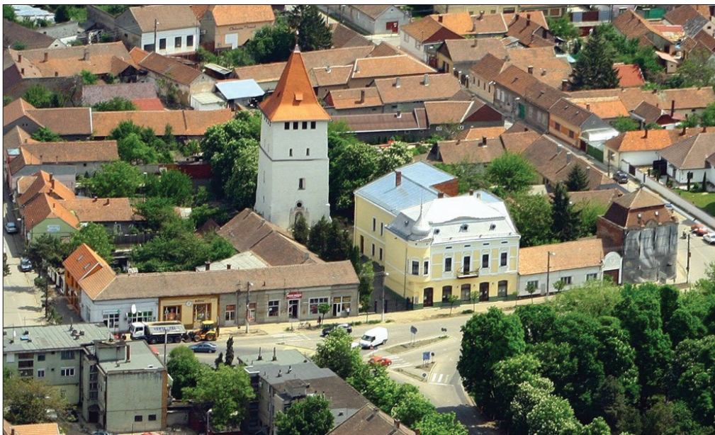
Nagyszalonta, Arany János... és Fábíán Gyula szülővárosa

A felgyorsult idő múlásával napról napra fogy a tábor, mindig kevesebb jut az anyagi támogatásukra, de nem lehet, hogy teljesen elfelejttesse egyetlen nép is azt a kultúrát, amely él, hat és termékenyít, hiszen ez történelmünk egyik alappillére, amelyre mindig építhetünk.