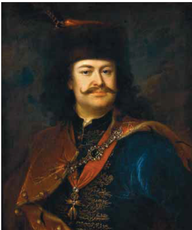
Mányoki Ádám: II. Rákóczi Ferenc, 1724.

A magyar történelem egén sok fényes csillag vonult át, amelyek kialudván örök homályt hagytak maguk után, vagy nemzetünk vezérsillagaivá lettek. Mi minden történhetett volna másképp, ha például Szent Imrét és Zrínyi Miklóst nem találja meg a vadkan? Ha a Zrínyiek utódát, II. Rákóczi Ferencet egy dicső, de a nemzet erőit vég-sőkig kimerítő szabadságharc után nem fosztják meg birtokaitól, és nem kényszerül éppen annak a már röviddel azelőtt hazánkból kiebrudalt török birodalomnak az oltalmába, melynek félholdas zászlaját 150 évig lengette a balsors hazánk véráztatta földje felett? Ha Széchenyi István, a magyar szemlélet hatékony formálója, legtevékenyebb, legintuitívabb