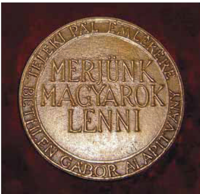
Teleki Pál Emlékérem (Bethlen Gábor Alapítvány)

Megjelent: Heti Válasz, 2005. 12. sz., 36–37. o.