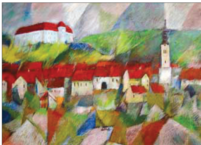
Gálics István: Lendva látképe 1973, olaj-vászon, 73,5×102 cm

G álics István*, a nemzetközi hírű képzőművész szülőföldjén, Lendván 2020. március elején jártunk. A Budapesten élő Lovászi Tóth József elektrografikus kiállítása március 4-én nyílt meg a Bánffy Központban. Gálics István állandó kiállítását a várban tekintettük meg. Még a szerény szakmai felkészültségű néző számára is feltűnhetett a két képi világ közötti szellemi közelség. Lovászi Tóth József kiállításának címe: Tér-Idő-Utazás . Hagymás István Gálics Istvánról írt monográfiájának címe pedig Az alsólendvai csillag . A két alkotót nem pusztán a vérrokonság, az unokatestvérség, a szülőföld és a lepkegyűjtés szenvedélye, hanem a kozmikus vizuális szemlélet köti egymáshoz, s még egy nagyon fontos dolog: egy szellemtörténetileg és antropológiailag is csak intuitíven megragadható különös sajátosság, aminek nyomvonalai itt Közép-Európában, illetve a Magyar Szent Korona territóriumában fedezhetők fel.