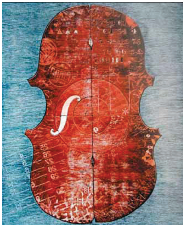
Gálics István: Nagy hegedű 1978, színes fametszet 97×65,5 cm

E sorozat egyedülálló érték, nemcsak a magyar és szlovén képzőművészetben, hanem az európai művészetben is. Mert az európai és az emberi létünk alapjait érinti. Azért, mert ezek a fossziliák, fametszetek, egyedi színes nyomatok s maguk a dúcok misztikus erőteret teremtenek. Ezek a dúcok nemcsak a magyar népművészet pásztorfaragásaival állnak szellemi