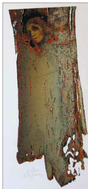
Gálics István: Önarckép, színes fametszet 1993, 100×70 cm

Egyáltalán nem véletlen, hogy a huszadik és huszonegyedik századi művészeknek nagyon nehéz egyéni hangvételt, ugyanakkor magas színvonalú képi világot felfedezniük. Gálics Istvánnak és Lovászi Tóth Józsefnek ez sikerült.