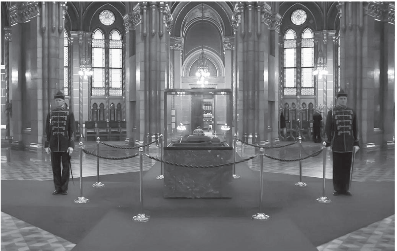
A Szent Korona az Országház kupolatermében

Mivelhogy a Szent Korona a mindenkori politikai nemzet számára, a Szent Korona tagjai számára elsősorban a szabadságjogokat, a méltányosságot, illetve a jogbiztonságot jelentette, a Szent Korona országainak szabad polgárai természetesen övezték hálával, szeretettel, tisztelettel. Tisztelve szerették mindazok, akik a törvények, az alkotmány megtartását nem érezték terhesnek, félve tisztelték azok, akik a törvényeket csak kényszerűségből tartották meg. És emlékeztetünk itt arra is, hogy a régi