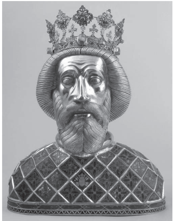
Szent László ereklyetartó mellszobra – Győr