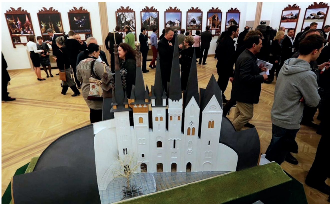
Makovecz Imre kiállításának megnyitóján a Pesti Vigadóban, 2014. 03. 16.