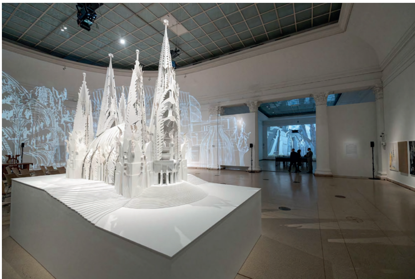
Angyalok és építészet - Makovecz Imre 90 című kiállítás a Múcsarnokban (2025)